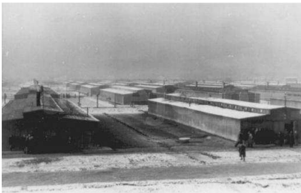
Auschwitz II-Birkenau. Fragment odcinka BII z drewnianymi barakami, tuż po ukończeniu jego budowy

Pierwsi więźniowie trafili do Birkenau na początku 1942 r. 1 marca trafiło tu między innymi 945 żyjących jeszcze jeńców sowieckich z ogólnej liczby około 10 tys., którzy trafili do KL Auschwitz jesienią 1941 r.. Ogółem w marcu umieszczono w nim kilka tysięcy więźniów. W tym czasie w KL Auschwitz I utworzono oddział kobiecy.