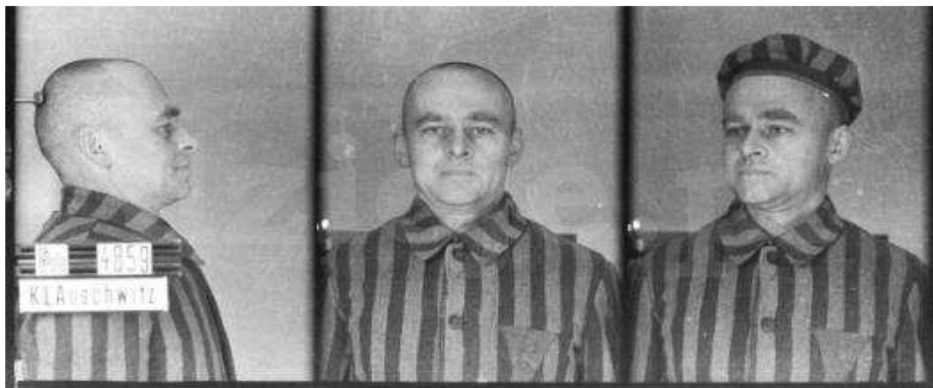
Fotografia obozowa rotmistrza Witolda Pileckiego.

Prace przygotowawcze trwały od maja do połowy czerwca. Zainicjowała je decyzja o wysiedleniu około 1200 osób, mieszkających na terenach w pobliżu powstającego obozu. Teren porządkowało 300 oświęcimskich Żydów. Przy pracach remontowych Hoess zatrudnił też kilkunastu polskich robotników. 20 maja 1940 r. Rapportfuehrer Gerhard Palitzsch przywiózł do Auschwitz 30 więźniów, niemieckich kryminalistów osadzonych w Sachsenhausen. Na rękach wytatuowano im numery od 1 do 30. Pierwszym starszym obozu (Lageraelteste) został owiany złą sławą, sadystyczny Bruno Brodniewitsch (numer obozowy 1). Więźniowie ci stworzyli zaczątek kadry funkcyjnej. Za datę uruchomienia obozu uważa się 14 czerwca 1940 r. Tego dnia do KL Auschwitz z więzienia w Tarnowie dotarł pierwszy transport 728 polskich więźniów politycznych, skierowanych tu przez dowódcę policji bezpieczeństwa i służby bezpieczeństwa w Krakowie. Wśród nich byli żołnierze kampanii wrześniowej, którzy usiłowali przedrzeć się na Węgry, członkowie podziemnych organizacji niepodległościowych, gimnazjaliści i studenci, a także kilka osób pochodzenia żydowskiego.