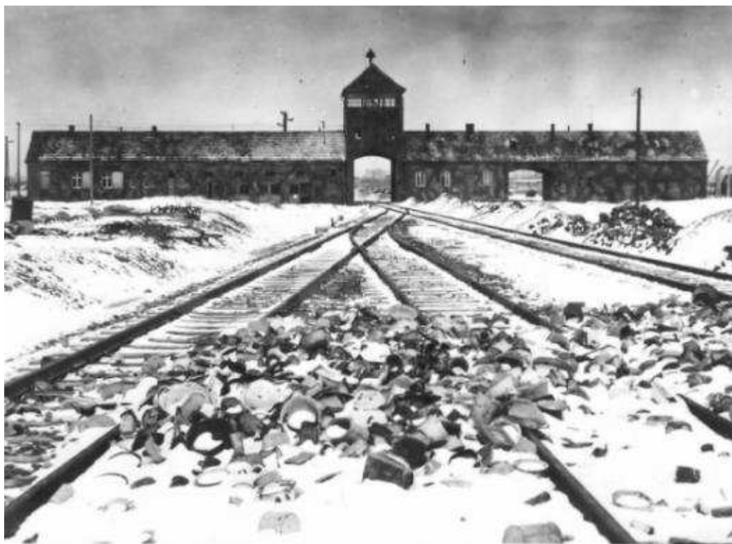
Auschwitz II - Birkenau - brama zwana Bramą Śmierci. w lutym lub marcu 1945 r.