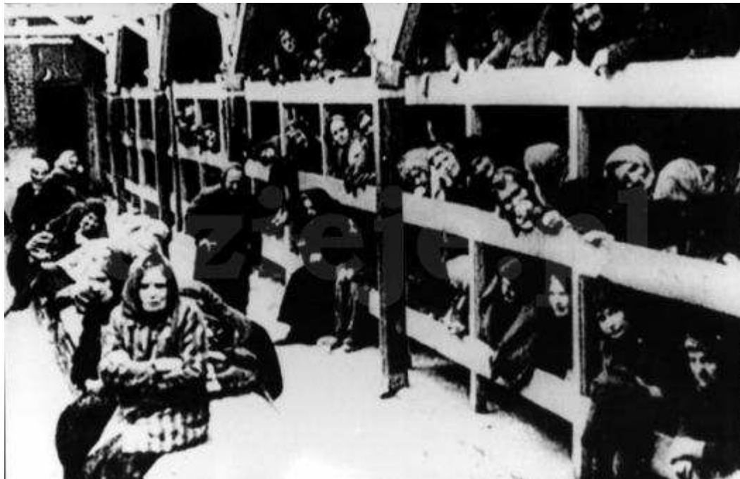
KL Auschwitz .01.1945. Obóz koncentracyjny po wyzwoleniu przez Armię Czerwoną. Nz: więźniowie obozu w baraku na pryzkach