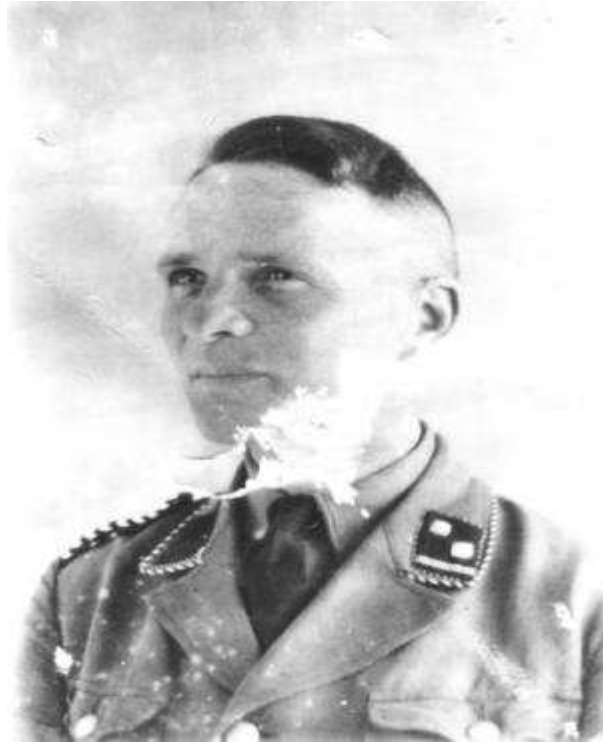
Rudolf Hoess - komendant KL Auschwitz od maja 1940 do listopada 1943 r.

Prace przygotowawcze trwały od maja do połowy czerwca. Zainicjowała je decyzja o wysiedleniu około 1200 osób, mieszkających na terenach w pobliżu powstającego obozu. Teren porządkowało 300 oświęcimskich Żydów. Przy pracach remontowych Hoess zatrudnił też kilkunastu polskich robotników. 20 maja 1940 r. Rapportfuehrer Gerhard Palitzsch przywiózł do Auschwitz 30 więźniów, niemieckich kryminalistów osadzonych w Sachsenhausen. Na rękach wytatuowano im numery od 1 do 30. Pierwszym starszym obozu (Lageraelteste) został owiany złą sławą, sadystyczny Bruno Brodniewitsch (numer obozowy 1). Więźniowie ci stworzyli zaczątek kadry funkcyjnej. Za datę uruchomienia obozu uważa się 14 czerwca 1940 r. Tego dnia do KL Auschwitz z więzienia w Tarnowie dotarł pierwszy transport 728 polskich więźniów politycznych, skierowanych tu przez dowódcę policji bezpieczeństwa i służby bezpieczeństwa w Krakowie. Wśród nich byli żołnierze kampanii wrześniowej, którzy usiłowali przedrzeć się na Węgry, członkowie podziemnych organizacji niepodległościowych, gimnazjaliści i studenci, a także kilka osób pochodzenia żydowskiego.