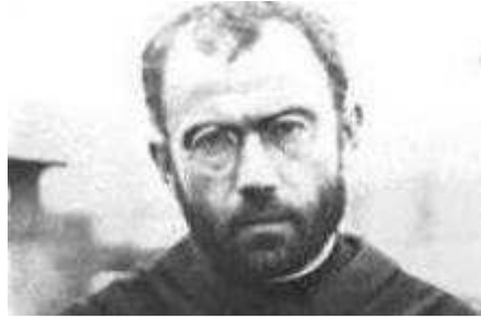
O. Maksymilian Maria Kolbe.