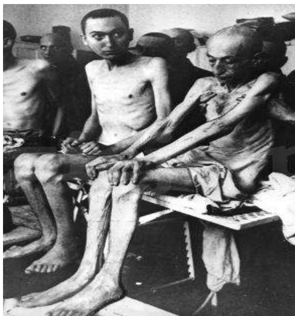
Luty 1945. Więźniowie obozu koncentracyjnego Auschwitz.

Komendant KL Auschwitz Rudolf Hoess po klęsce Niemiec ukrywał się pod nazwiskiem Franza Langera w brytyjskiej strefie okupacyjnej. 11 lutego 1946 r. został rozpoznany i aresztowany, a następnie wydany Polsce, gdzie wyrokiem Najwyższego Trybunału Narodowego skazano go na śmierć. 16 kwietnia 1947 r. został powieszony w byłym KL Auschwitz, obok budynku komendatury, w której urzędował