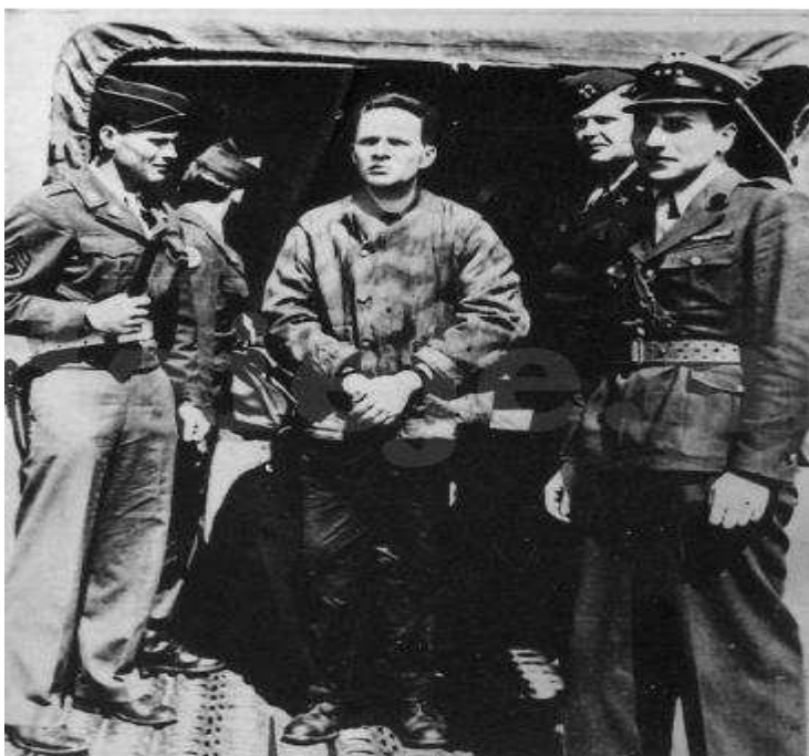
Deportacja b. komendanta KL Auschwitz R. Hoesa do Polski w 1946 r.

Komendant KL Auschwitz Rudolf Hoess po klęsce Niemiec ukrywał się pod nazwiskiem Franza Langera w brytyjskiej strefie okupacyjnej. 11 lutego 1946 r. został rozpoznany i aresztowany, a następnie wydany Polsce, gdzie wyrokiem Najwyższego Trybunału Narodowego skazano go na śmierć. 16 kwietnia 1947 r. został powieszony w byłym KL Auschwitz, obok budynku komendatury, w której urzędował