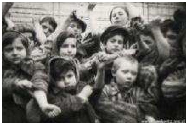
Dzieci z KL Auschwitz wyzwolone przez żołnierzy sowieckich.