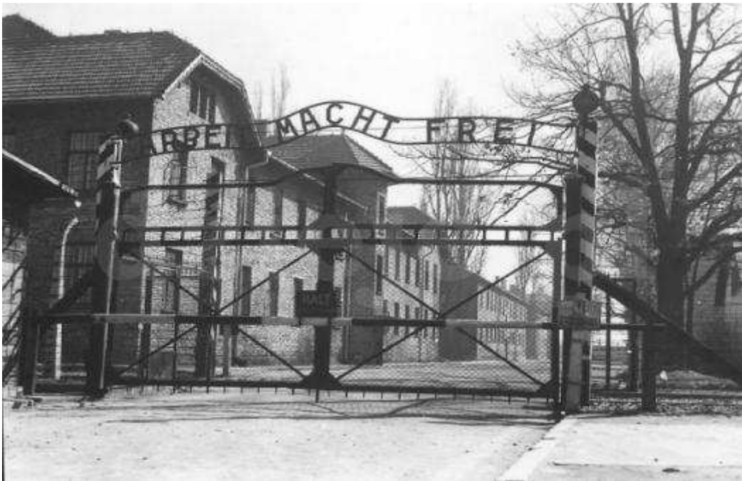
Auschwitz - brama obozu.

Projekt stworzenia w Oświęcimiu obozu koncentracyjnego zrodził się w Urzędzie Wyższego Dowódcy SS i Policji we Wrocławiu, na którego czele stał Gruppenfuehrer SS Erich von dem Bach-Zelewski. Z projektem wystąpił jeszcze pod koniec 1939 r. podległy mu inspektor policji bezpieczeństwa i służby bezpieczeństwa Oberfuehrer SS Arpad Wigand. Nazistów niepokoiły mnożące się raporty o przepełnieniu więzień na Górnym Śląsku i w Zagłębiu Dąbrowskim. Narastał ruch oporu, który można było ugasić jedynie stosując masowe aresztowania. Istniejące obozy koncentracyjne nie wystarczały, by osadzić wszystkich zatrzymanych.