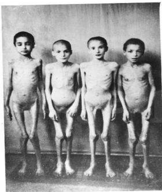
Dzieci będące przedmiotem eksperymentów dr Jozefa Mengele