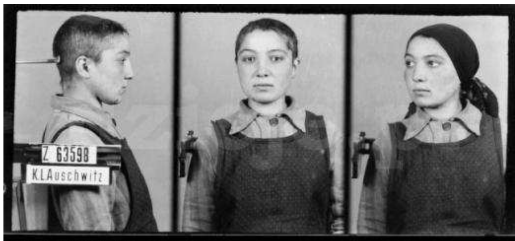
Jedna z nielicznych zachowanych fotografii obozowych więźniarki obozu cygańskiego.

26 marca trafiło do niego 999 niemieckich więźniarek z KL Ravensbrueck oraz 999 Żydówek, przywiezionych z Popradu na Słowacji. 27 kwietnia 1942 r. osadzono tam pierwsze więźniarki polskie - 127 kobiet z Tarnowa i krakowskiego więzienia Montelupich.